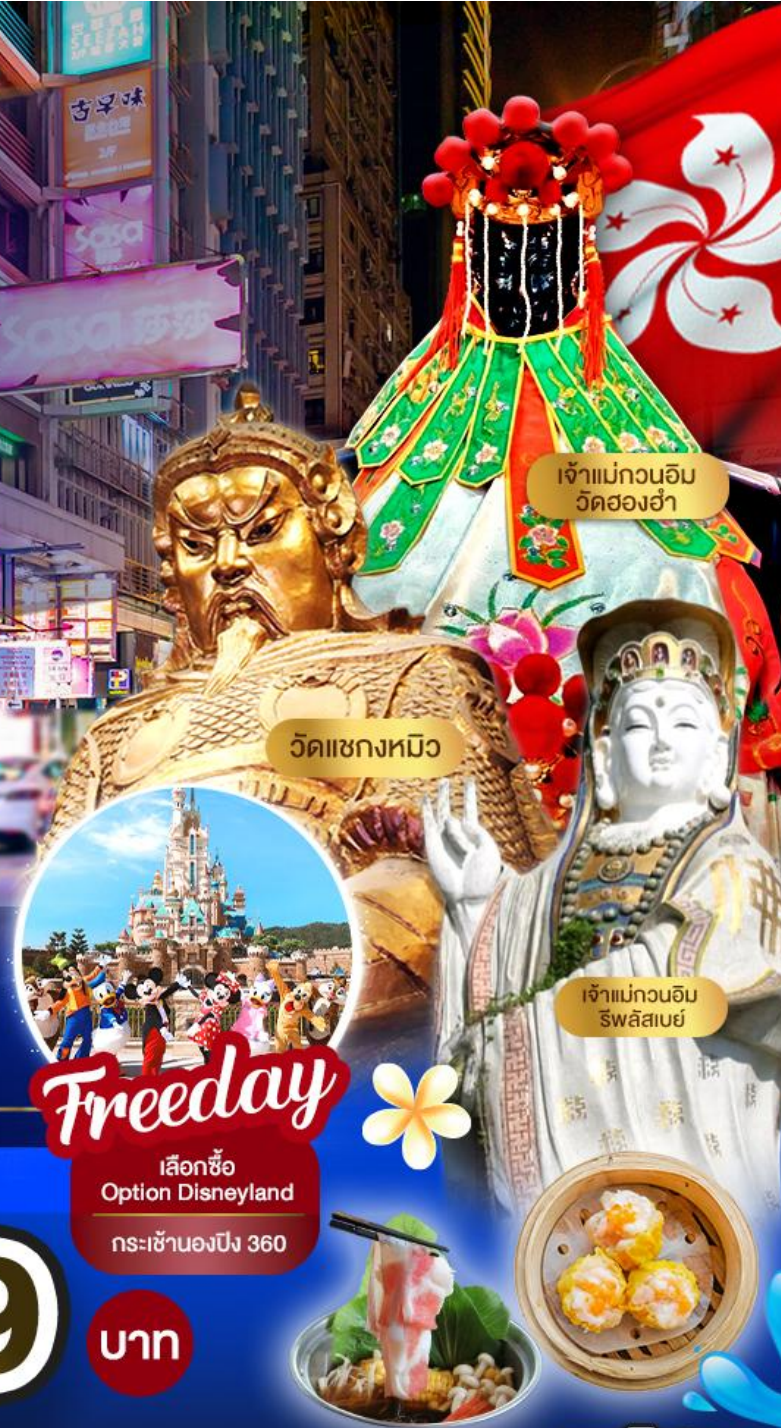
เจ้าแม่กวนอิม วัดสองฮ่า