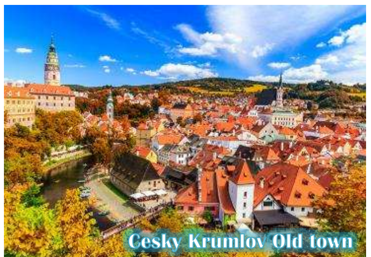
Cesky Krumlov Old town

บ่าย นำท่านเดินทางสู่ “เมืองเชสกี้ คุมลอฟ (เมืองมรดกโลก)” เป็นเมืองขนาดเล็กในภูมิภาคโบฮีเมียใต้ของ สาธารณรัฐเช็กมีชื่อเสียงจากสถาปัตยกรรม และศิลปะของเขตเมืองเก่าและปราสาทคุ มลอฟ ที่ยังคงมีเสน่ห์เหมือนอยู่ในเทพนิยายมา จนถึงทุกวันนี้ และน่าจะเป็นเมืองที่สวยงามที่สุดใน สาธารณรัฐเช็ก, เชสกี้ คุมลอฟได้รับการจัด อันดับให้อยู่ในสิบเมืองที่สวยงามที่สุดในโลก เป็น หนึ่งในสถานที่ที่สวยงามที่สุดและไม่ควรพลาด ในการเดินทางไปสาธารณรัฐเช็ก เดินเล่นไปบน ถนนในยุคกลาง ปราสาทสไตล์บาโรกที่ไม่บุบ สลาย และแม่น้ำที่คดเคี้ยว เมืองเก่าที่งดงามแห่งนี้ได้รับการอนุรักษ์ไว้อย่างดีจากอดีตและการทิ้งระเบิดใน สงครามโลกครั้งที่ 2 ทั้งหมดทำให้เมืองที่มีทิวทัศน์แห่งนี้รู้สึกเหมือนอยู่ในเทพนิยายจากยุคกลางสู่ความเป็นจริง