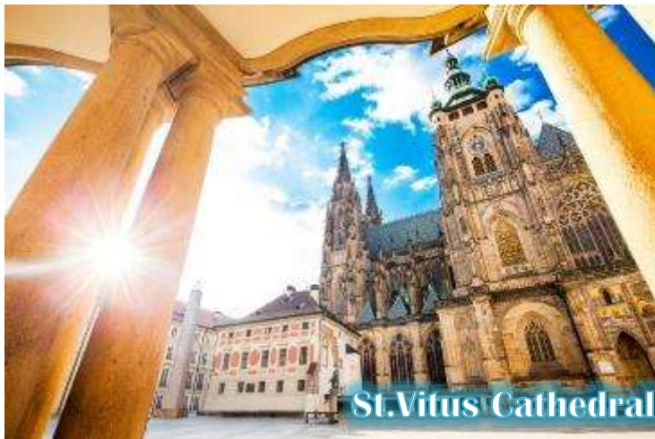
St. Vitus Cathedral