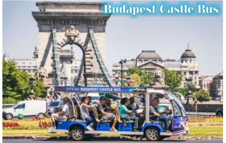
Budapest Castle Bus

บูดา Castle Hill *เนื่องจากตัวปราสาทตั้งอยู่บนเนินเขา การเดินทางโดยรถไฟไฟฟ้า จะเพิ่มความสะดวกสบายให้กับท่าน โดยรถไฟไฟฟ้าจะจอดรับและส่งตามจุดต่างๆ ในย่านเมืองเก่า ไม่ต้องเดินเท้าเป็นระยะทางไกล* จากนั้นนำท่านเดินชมความงดงามของเมืองเก่ารอบๆปราสาทบูดา ที่เริ่มมีการก่อสร้างมาตั้งแต่ปี ค.ศ.1265 และต่อเติมปรับปรุงมาโดยตลอด จนกระทั่งปัจจุบัน โดยตัวอาคารในปัจจุบันเราจะเห็นเป็นสไตล์บาโรค ที่ดู