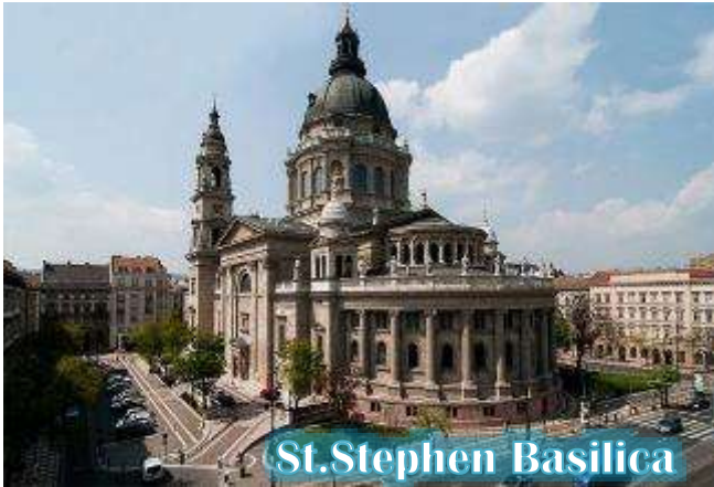
St. Stephen Basilica