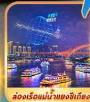
ส่องเรือแม่น้ำแยงซีเกียง