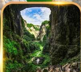
อุทยานหลุมฟ้า 3 สะพานสวรรค์