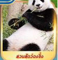
สวนสัตว์จงจิ่ง