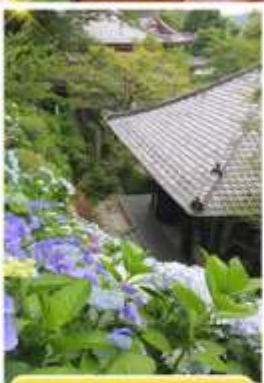
วัดฮาเซเดระ