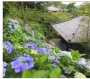
วัดฮาเซเดระ(เดรนเยีย)