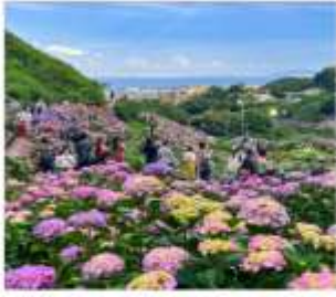
เทศกาลดอกไฮเดรนเยีย