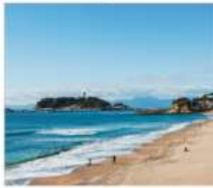
เกาะเอโนชิมะ