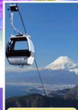
อิซุพานอรามาวิว

ออนเซ็น 1 คั้น นน.กระบี่ 23 กก. 7Days 4Night