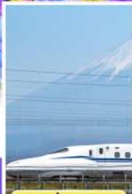
สัมผัสนั่งชินคันเซน