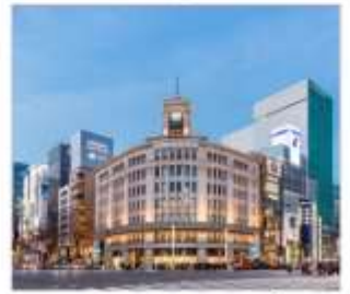
กินข้า้ออปปิ้ง