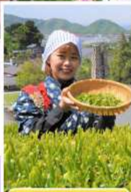
กิจกรรมเก็บชาเขียว