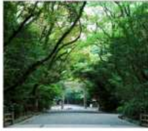
ศาลเจ้าอัสึตะ