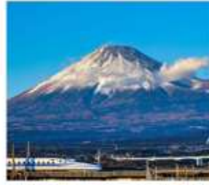
นั่งชินคันเซนชมฟูจิ