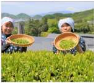
กิจกรรมเก็บชา