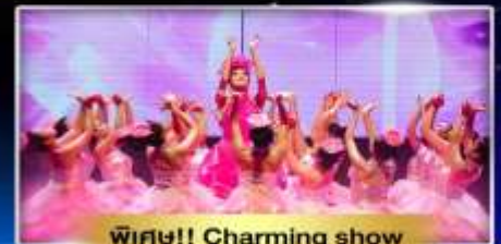
พิเศษ!! Charming show