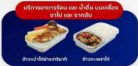
บริการอาหารร้อน และ น้ำดื่ม บนเครื่อง ขาไป และ ขากลับ