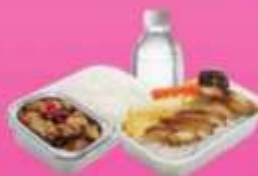
บริการอาหารร้อนบนเครื่อง ซาโป - ซากสึบ