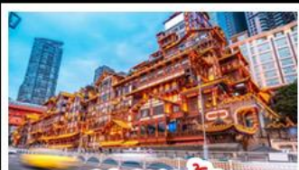
เจียงหยาดัง

อุทยานหลุมบ่อฟ้า - อุทยานเจานางฟ้า หงหยาดัง - นังรถไฟทะเลลุดัก - อุทยานสีดรุณี ปี้ผิงโกว - สะพานหนานเฉียว