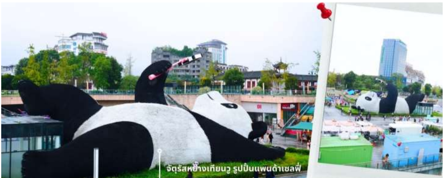
จัตุรัสหยางเทียนหวู่ รูปปั้นแพนด้าเซลฟี่

นำท่านเดินทางไปยัง จัตุรัสหยางเทียนหวู่ เป็นจุดเช็คอินที่สำคัญสำหรับคนที่มาเที่ยวที่ เมืองดูเจียงเยียน บริเวณจุดท่าข้าม อำเภอดูเจียงเยียน นครเฉิงตู ไฮไลท์ของจัตุรัสหยางเทียนหวู่ คือ ประติมากรรม แพนด้ายักษ์ที่กำลังนอนหงายท้องยื่นมือถือไม้เซลฟี่สีชมพู ซึ่งออกแบบโดยนักออกแบบชื่อดัง Florentijn Hofman รูปปั้นแพนด้า ยักษ์มีความยาว 26 เมตร กว้าง 11 เมตร สูง 12 เมตร และหนัก 130 ตัน แบบท่าทางสบายๆของแพนด้าที่ความประทับใจและรอยยิ้มให้กับผู้ที่มาเยือนจัตุรัสหยางเทียนหวู่ สามารถดึงดูดนักท่องเที่ยวได้เป็นจำนวนมากเลยทีเดียว เป็นการแสดงออกด้วยภาษาทางศิลปะแบบหนึ่งที่สะท้อนชีวิตในท้องถิ่น มอบความรู้สึกสนิทสนมและมีความสุขกับผู้ชม อิสระเดินชม