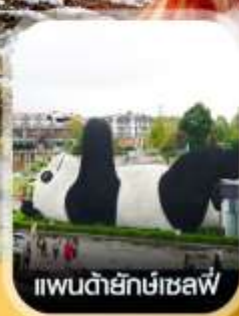
แพนด้ายักษ์เซลฟี

✈️ คอนเฟิร์ม ออกเดินทาง ✈️ ทุกพีเรียด 2 ท่านขึ้นไป