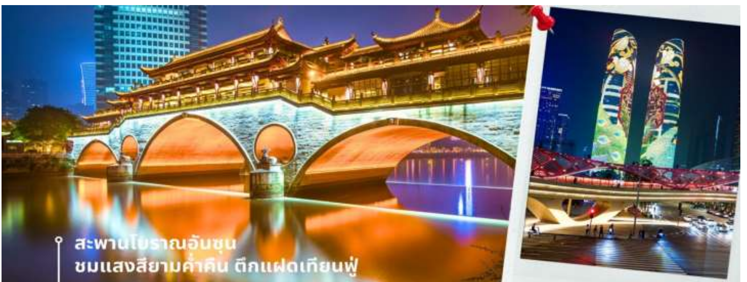
สะพานโบราณอันชุน ชมแสงสียามค่ำคิน ตึกแฝดเทียนฟู

➔ นำท่านเดินทางเข้าที่พัก AC HTL MARRIOTT 4 ดาวหรือเทียบเท่า