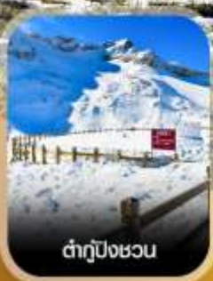
ต่ากู่ปิงชวน