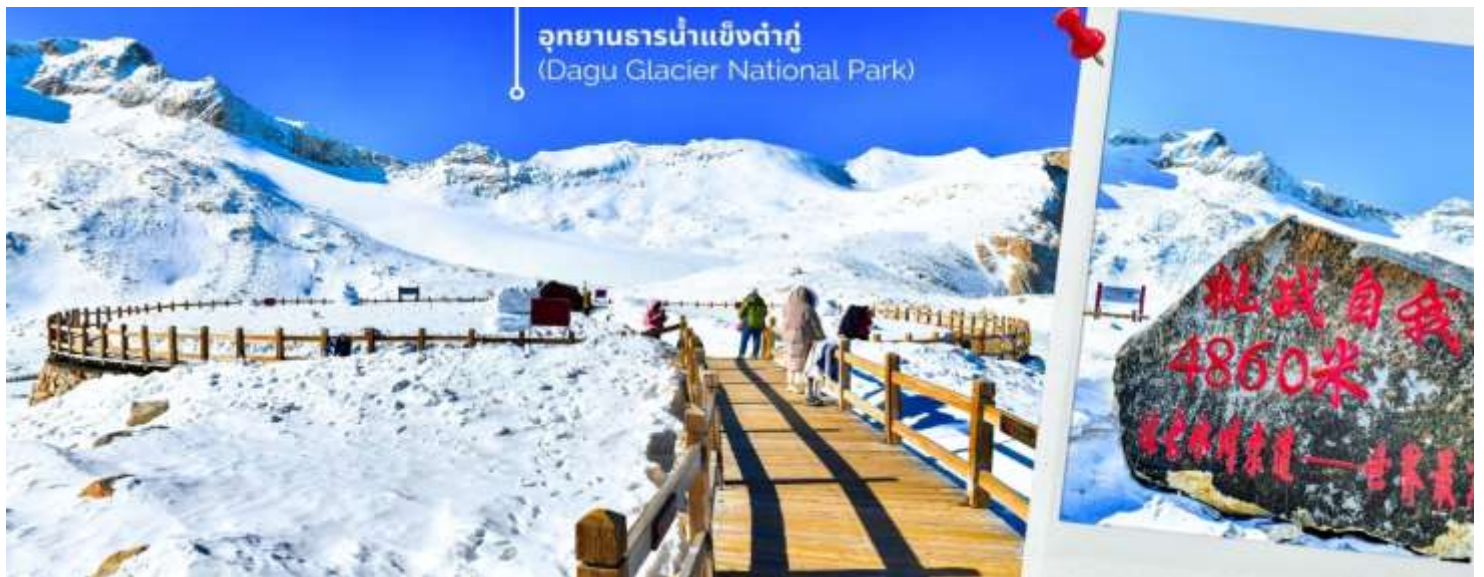
ความหนาวของหิมะขึ้นอยู่กับสภาพอากาศ

จากนั้นนำท่านเดินทางสู่ เมืองเฮยสุ่ย (ใช้เวลาเดินทางประมาณ 2 ชั่วโมง)เพื่อเดินทางไปยัง อุทยานธารน้ำแข็งต้ากู่ (รวมกระเช้าขึ้นลง) ต้ากู่ปิงชว่น หรือ Dagu Glacier National Park เป็นธารน้ำแข็งกลางเขี้ยวที่สวยงามที่สุดแห่งหนึ่งของโลกและเป็นสถานที่ท่องเที่ยวระดับ 4A ของจีน ตั้งอยู่ที่เมืองเฮยสุ่ย ในมณฑลเสฉวน ห่างจากเมืองเฉิงตู ประมาณ 300 กิโลเมตร ถือเป็นธารน้ำแข็งที่อายุน้อยที่สุด ที่ตั้งอยู่ในระดับความสูงที่ต่ำที่สุดและอยู่ใกล้กับเมืองมากที่สุด ในบรรดาธารน้ำแข็งทั้งหมด โดยอยู่สูงจากระดับน้ำทะเลประมาณ 3,800-5,100 เมตร จุดสูงที่สุดที่นักท่องเที่ยวสามารถขึ้นไปได้จะอยู่ที่ 4,860 เมตร