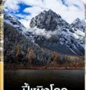
ปีเผิงโกว