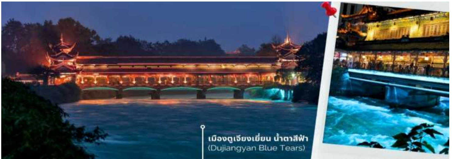
เมืองดูเจียงเยียน น้ำตาสีฟ้า (Dujiangyan Blue Tears)

ราวกับโลกแห่งจินตนาการ ความพิเศษอยู่ที่การจัดไฟอย่างประณีต ซึ่งช่วยเน้นให้สะพานมีชีวิตชีวาท่ามกลางบรรยากาศยามค่ำคืนที่รายรอบไปด้วยภูเขาและต้นไม้เพิ่มความรู้สึกสงบและสดชื่น เมื่อเดินข้ามสะพานนี้แล้วได้สัมผัสกับบรรยากาศรอบๆ มีแสงไฟที่ส่องประกายลงสู่ผืนน้ำจึงเป็นประสบการณ์ที่ทำให้รู้สึกผ่อนคลายและเต็มไปด้วยความประทับใจที่ยากจะลืม