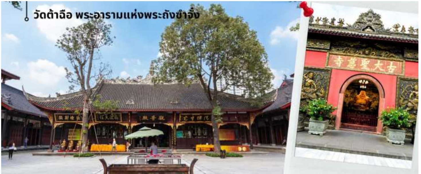
วัดต้าฉือ พระอารามแห่งพระถังซำจั๋ง

เดินทางกลับเฉิงตูชม วัดต้าฉือ พระอารามแห่งพระถังซำจั๋ง ใจกลางนครเฉิงตู พระถังซำจั๋ง ได้รับการสรรเสริญว่าเป็นผู้มีความเพียร และมีชื่อเสียงมายาวนานกว่า 1,400 ปี และยังได้รับการยกย่องว่าเป็น พระไตรปิฎกแห่งราชวงศ์ถัง พุทธประวัติของพระถังซำจั๋งถูกจารึกในสถานที่ต่างๆมากมาย รวมไปถึงได้ถูกกล่าวถึงในจดหมายเหตุหลายเล่ม ตามเส้นทางการเดินทางแห่งความเพียรของท่าน รวมทั้งมีพระอัฐิของท่าน ประดิษฐานอยู่ในพระอารามของนครนานจิง และที่ทะเลสาบสุริยันจันทราเป็นเกาะใต้หวนอีกด้วย