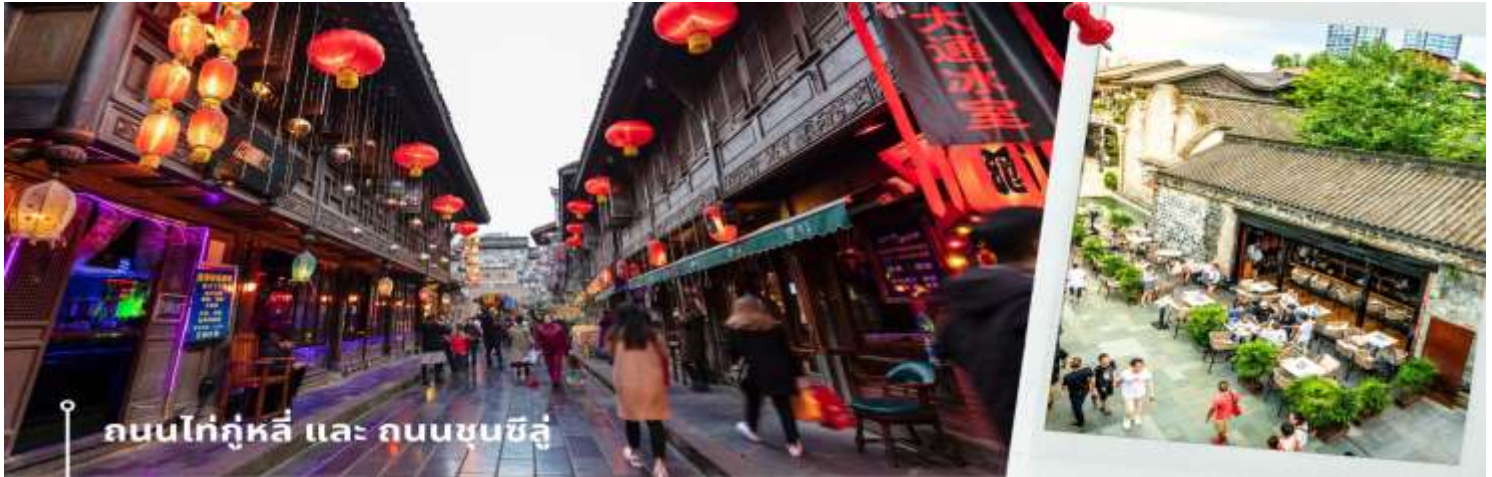
ถนนไถ่กุหลี่ และ ถนนซุนซีลู่

จากนั้นให้ท่านให้อิสระกับการเลือกซื้อสินค้าของฝากที่ ถนนไถ่กุหลี่ และ ถนนซุนซีลู่ ในย่านนี้เป็นถนนโบราณ ในอดีตเคยโรงงานผลิตผ้าไหมใหญ่ที่สุดในจีน ปัจจุบันได้เปลี่ยนเป็นถนนช้อปปิ้งแหล่งสวรรค์ของนักท่องเที่ยว เป็นถนนคนเดินมีห้างสรรพสินค้าชื่อดัง มีร้านค้ามากกว่า 700 ร้านค้าที่เต็มไปด้วยสินค้าต่าง ๆ ทั้งร้านค้าแฟชั่น ร้านอาหาร และโรงแรมนานาชาติมากมายซึ่งเป็นที่เที่ยวเชิงดูที่มีการเชื่อมต่อทางวัฒนธรรมท้องถิ่นที่เป็นแหล่งช้อปปิ้งและเป็นแหล่งร้านอาหารที่อร่อยต่าง ๆ มากมาย ซึ่งเป็นสถานที่เที่ยวของเชิงดูที่ทำให้เพลิดเพลินกับสินค้าแบรนด์เนมและแบรนด์จีน เพื่อให้นักท่องเที่ยวได้เลือกซื้อตามอิสระ