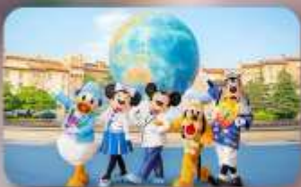
อิสระตามอียาสัย 2 วัน

HOTEL ASIA NARITA ห้องเตียงสามมาตรฐานคู่เตียง