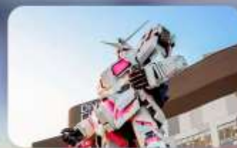
ช้อปปิงโอไดบะ