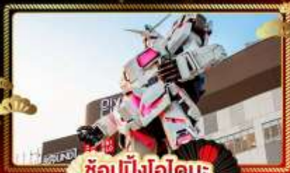
ช้อปปิ้งไอโดะ