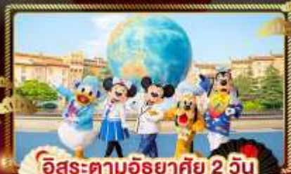
อิสระตามอัยาศัย 2 วัน