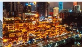
หงหยาดัง(ชมไฟยามค่ำคืน)

*ทางบริษัทฯ ขอสงวนสิทธิ์ในการสลับโปรแกรมทัวร์ตามความเหมาะสมขึ้นอยู่กับสถานการณ์หน้างาน โดยคำนึงถึงผลประโยชน์ของลูกค้าเป็นสำคัญ