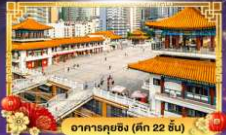
อาคารคุยฉิ่ง (ตึก 22 ชั้น)