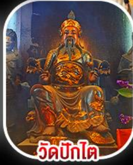
วัดบิกิต