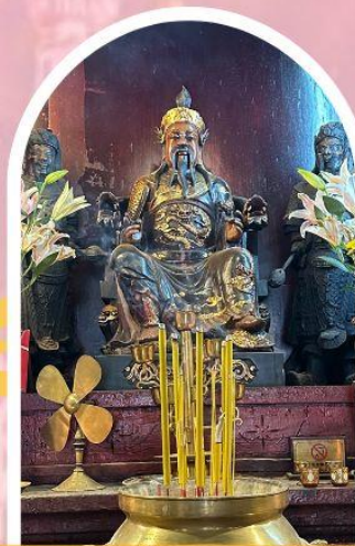
วัดปักไต้ฮ่องกง