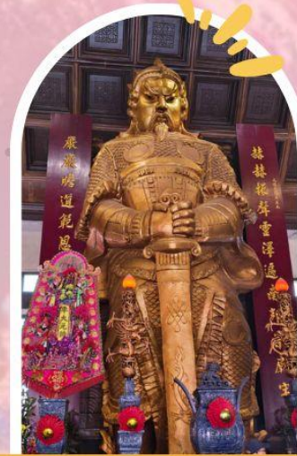
วัดแซกง ขอพรโชคลาก การเงิน และธุรกิจ