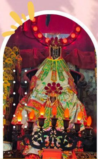
วัดเจ้าแม่กวนอิมฮ่องกง ขอพรเรื่องเงิน ทรัพย์สิน และความมั่งคั่ง