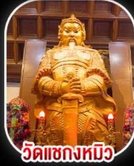
วัดเขกเหมียว

วัดเขกเหมียว- วัดเจ้าแม่กวนอิมฮ่องกง พระใหญ่ไ่่วหลิน + กระเช้าเองปิง เมนูสุดพิเศษ!! ต้มข้าวฮ่องกง บุฟเฟ่ต์ชาบูสไตล์ฮ่องกง และห่านย่าง อิสระท่องเที่ยวดิสนีย์แลนด์ 1 วัน เลือกซื้อบัตรดิสนีย์แลนด์หรือช้อปปิ้งจุใจ