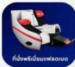
ที่นั่งพรีเมียมแฟล็ก

บริการอาหารร้อน และ น้ำดื่ม บนเครื่อง ขาไป และ ขากลับ