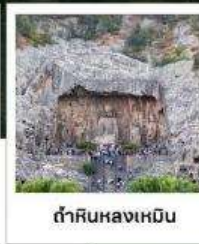
ถ้ำหินหลงเหมิน