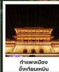
กำแพงเมือง อี้เกียนเหมิน

ชม..ชิม..ช้อปปิ้ง!!... “ ต้าซ่าระดับ..UNESCO ”