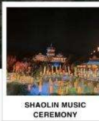
SHAOLIN MUSIC CEREMONY