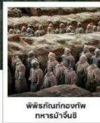
พิพิธภัณฑ์กองทัพทหารม้าจีน