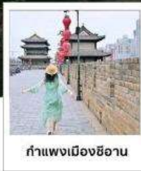
กำแพงเมืองซีอาน