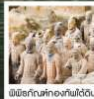
พิพิธภัณฑ์ทองคำฟงไต้ตัน

ทัวร์คุณภาพ ไม่ลงร้านช้อปปิ้ง ไม่ขายออปชั่น