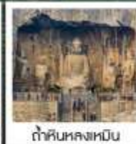
ถ้ำหินหลงเหมิน