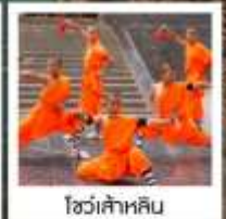
โชว์ลำหลิ้น

ตลาดกลางคืนไคเฟิง / ประตูเมืองเก่าต้าเหลียงเหมิน / สวนชิงหมิงซิ่งเหอ / อุทยานหยุ่นโกซ่าน (รวมรถอุทยาน) วัดลำหลิ้น (รวมรถแบตเตอรี่) / ป่าเจดีย์ / โชว์การแสดงวิทยายุทธลำหลิ้น / โชว์ SHAO LIN MUSIC CEREMONY / ถ้ำหินหลงเหมิน (รวมรถแบตเตอรี่) สุสานเทพเจ้ากวนอู / ถนนคนเดินสี่จั๊งเหมิน / เมืองลั่วอี้ + ฟริสไตลด์พื้นเมืองชาวฮั่น / กำแพงเมืองอังกีเยนเหมิน โชว์ราชวงศ์ถัง / พิพิธภัณฑ์ทองคำฟงไต้ตันอาหารน้ำจิ้มซี (รวมรถแบตเตอรี่) / กำแพงเมืองโบราณซื่ออัน / จิตรกรรมฝาผนัง + หอกทอง ตลาดมูสลิม / เจดีย์ห่านป่าใหญ่ / ถนนคนเดินวัฒนธรรมต้าถิง