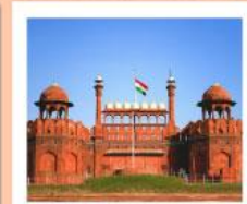
♥♦♦ Agra Fort