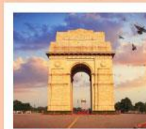
♥♦♦ India Gate