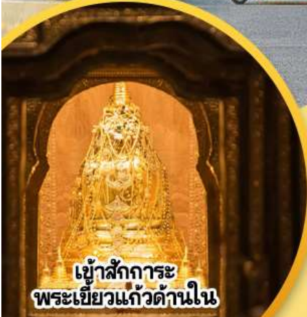
เข้าสู่การะ พระเขี้ยวแก้วด้านใน