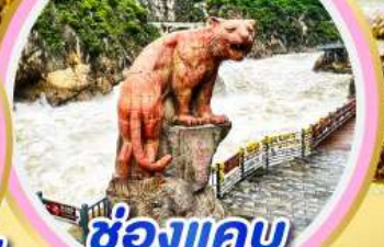
ช่องแคบ เสื่อกระโจน