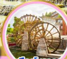
เมืองโบราณ ลี่เจียง

เดินทางช่วงเดือน ก.พ.-มี.ค.68 ชมเทศกาลซากุระ ณ สวนหยวนทง